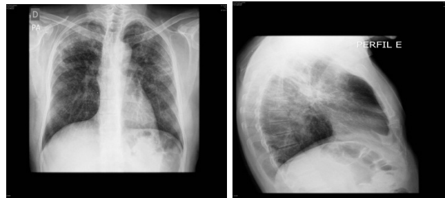
Radiografia do tórax PA e perfil

Paciente do sexo masculino, 40 anos de idade, com história de falta de ar progressiva há dois anos procura pneumologista para elucidação diagnóstica. Nega doenças pulmonares prévias e trabalha na construção de poços artesanais no Vale do São Francisco. Exame físico inalterado. Apresenta radiografia de tórax.